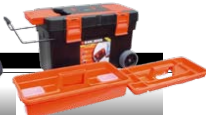
Black & Decker Master Mate

Her er masser af kapacitet til værktøj og tilbehør. Bunden er lavet af sej, slidbestandig plast, og tasken har forstærkede nitter overalt. 498 kr.