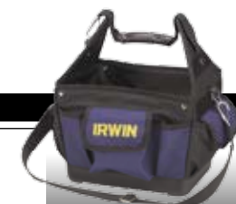
Irwin Pro Utility

Bahco er på banen med en hel serie af nye værktøjskasser i polypropylen. Med bl.a. udtræksbakker og nonslip-håndtag. Kan låses med hængelås. 500 kr.