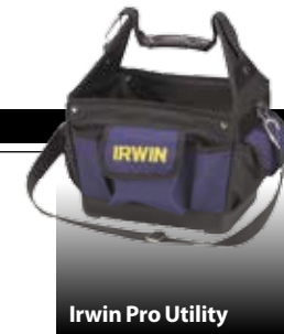
Irwin Pro Utility

Bahco er på banen med en hel serie af nye værktøjskasser i polypropylen. Med bl.a. udtræksbakker og nonslip-håndtag. Kan låses med hængelås. 500 kr.