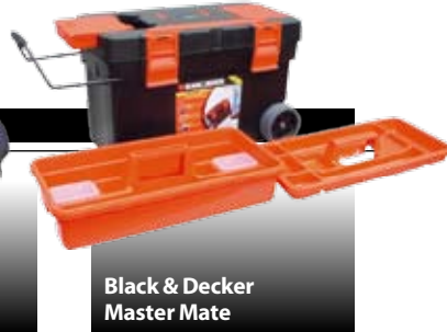
Black & Decker Master Mate

Her er masser af kapacitet til værktøj og tilbehør. Bunden er lavet af sej, slidbestandig plast, og tasken har forstærkede nitter overalt. 498 kr.