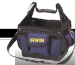
Irwin Pro Utility

Bahco er på banen med en hel serie af nye værktøjskasser i polypropylen. Med bl.a. udtræksbakker og nonslip-håndtag. Kan låses med hængelås. 500 kr.